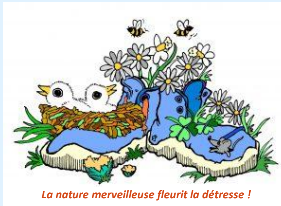
La nature merveilleuse fleurit la détesse !

3.3. Le 'parcours-découvertes Le Struthof' est proposé en juin ou début juillet à tous les Lorrains-Alsaciens qui le souhaitent. Si ce projet retient votre intérêt, n'hésitez pas à exprimer votre avis !