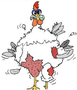
Je me dépouille, je vieillis ... mais je garde toute ma place !

Comment garder confiance et sérénité dans des moments difficiles ? Si vous êtes intéressé par cette proposition d'atelier, Merci de vous signaler en prenant contact !