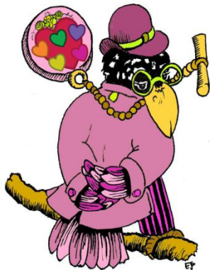
Hommoiseau, Avec son médaillon fleuri de coeurs !