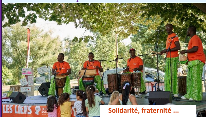
Solidarité, fraternité ...

. Ce "Mot Mensuel" nous permet "d'écouter et de partager" les principales nouvelles que vous nous transmettez chaque mois. Merci à tous ! Si votre boîte aux messages souffre d'être encombrée d'infos parfois intempestives, vous appréciez certainement que le Mot d'Ecoute et Partage offre régulièrement une sélection de données choisies. https://ecoutetpartage.fr/mots-mensuels/