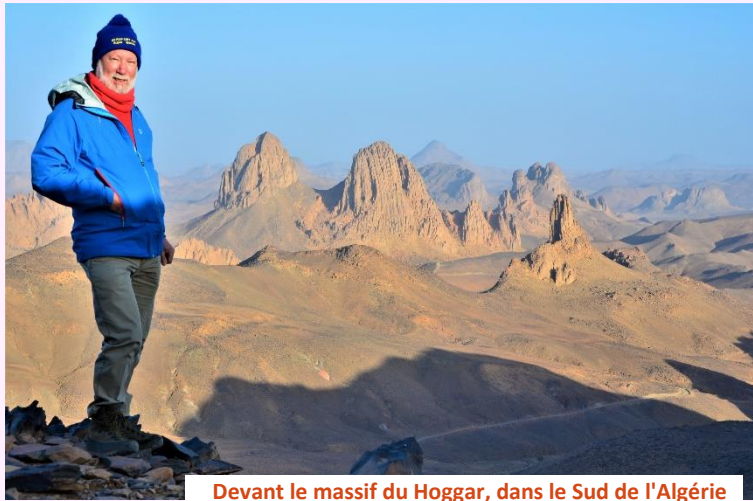
Devant le massif du Hoggar, dans le Sud de l'Algérie

? Entre ces deux perspectives, les enjeux sont confus pour la plupart d'entre nous. Ils sont cependant considérables. Etienne Hubert détaille et éclaire l'alternative ... Pour lire la suite, cliquer