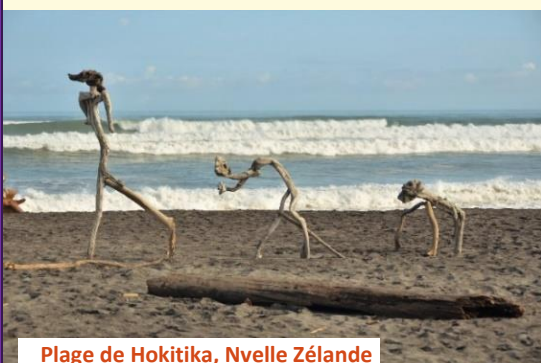
Plage de Hokitika, Nvelle Zélande

Il a placé un panier de délicieux fruits près d'un tronc d'arbre et leur a dit : « Le premier qui atteint l'arbre aura le panier de fruits » ... Pour découvrir la suite, cliquer !