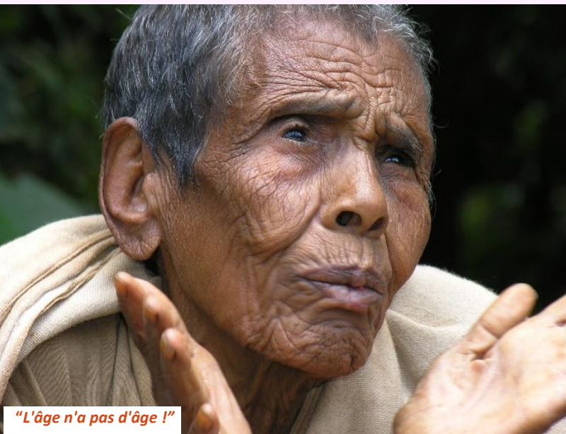
"L'âge n'a pas d'âge !"

Si l'on veut rester fidèle à l'homme de Nazareth comme à son Annonce et à la haute conception qu'il se fait de la dignité de l'humain, il faudra bien, un jour ou l'autre (un siècle ou l'autre peut-être ?), réécrire la liturgie de la célébration eucharistique. Si, pour l'essentiel, Jésus s'est opposé à l'Alliance -contrat par les prêtres sous Esdras (en - 397) entre Dieu et le peuple juif pour le pardon des péchés – ainsi qu'au monde des sacrificateurs qui ont fini par avoir sa peau, il faudra bien présenter, un jour, ledit « Sacrifice Eucharistique » autrement ! ... Pour lire la suite, cliquer