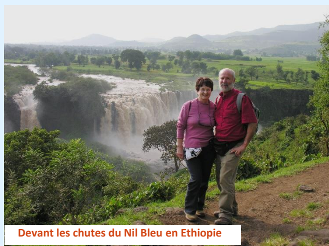
Devant les chutes du Nil Bleu en Ethiopie