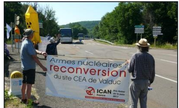
et près de Valduc (au passage des bus du CEA)