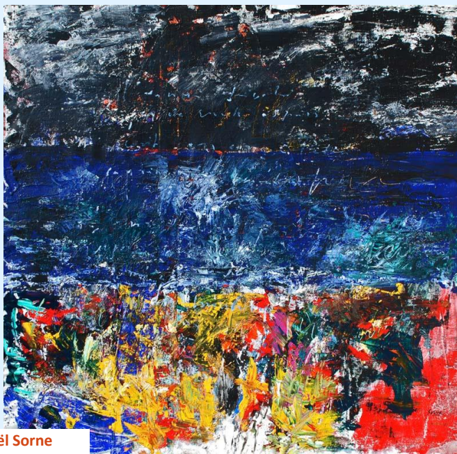
Brise-marine - Mickaël Sorne

Vous pouvez retrouver les derniers « Mots mensuels » parus en cliquant