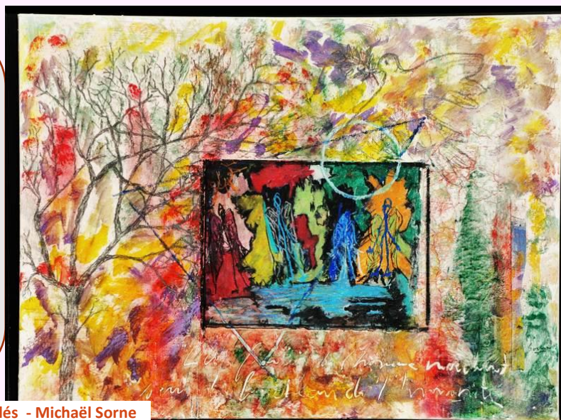
Tant mêlés - Michaël Sorne

Merci à l'avance pour votre participation, cliquer