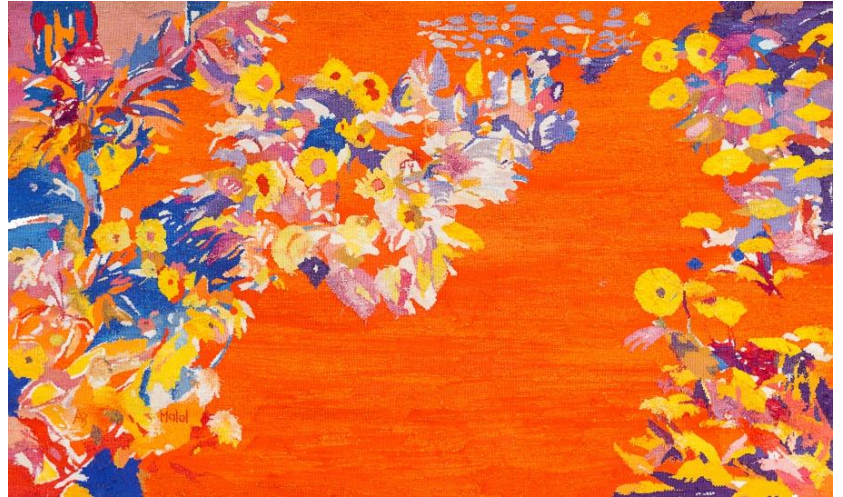
Fleurs oranges (tableau Malel)