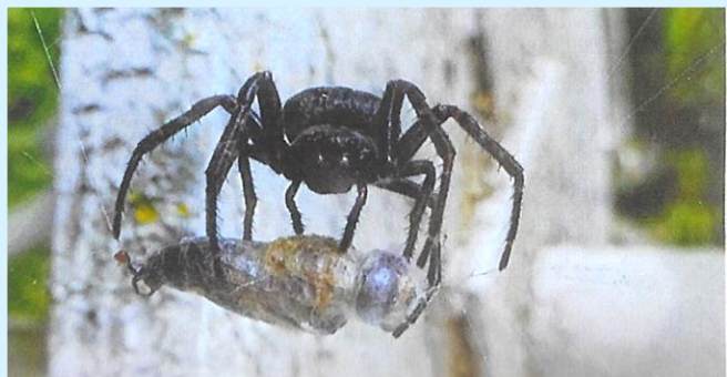
Araignée et butin ! .... Frandile

A cause de la situation sanitaire engendrée par le Covid, plusieurs étudiants de Lyon mais aussi d'autres jeunes dans d'autres villes ont tenté de se suicider en se défendant ou en avalant abusivement des médicaments ... Pour découvrir la suite, cliquer