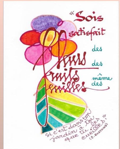
Fleurs, fruits, feuilles ... Frandile

Lecteurs de ce « Mot », vous pouvez prolonger l'échange... pour l'enrichir ou l'améliorer ! Merci à l'avance. Cliquer