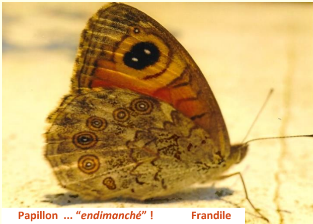
Papillon ... "endimanché" ! Frandile

Pour consulter les infos ou activités de partenaires, cliquer