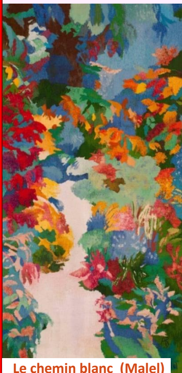
Le chemin blanc (Malel)

Je ne vais pas souhaiter à chacune et chacun une « bonne année, bonne santé et la réalisation de tous vos désirs » - même si bien entendu j'espère votre bien comme le mien. Quant à savoir ce qui, au final, est un mal ou un bien, je n'entretiens plus cette illusion ... Ce que je vais vous souhaiter ... Pour lire la suite, cliquer