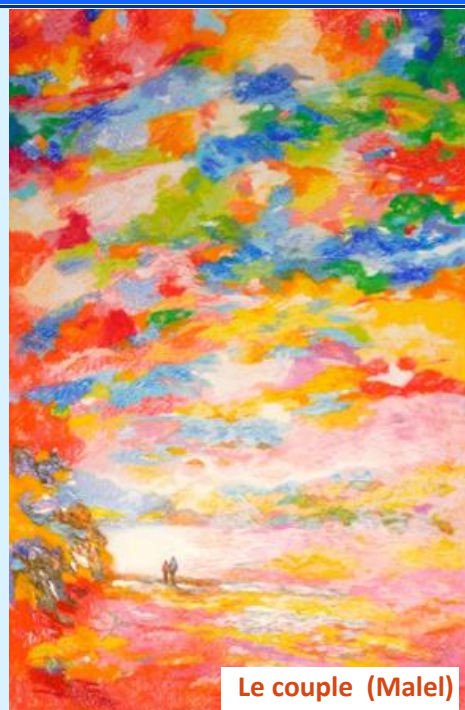
Le couple (Malel)

C'est avec beaucoup de réserves que j'essaie d'exprimer ce que je crois ! Car ce que je crois aujourd'hui ne sera peut-être pas tout à fait ce que je croirai demain. Et ce que je crois n'est de toute façon pas une certitude mais seulement une conviction ... Pour lire la suite, cliquer