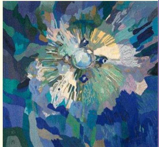
Le saint-sacrement bleu (Malel)

. Un toit. Nous pensons que chaque être humain mérite respect et considération; que chacun mérite d'être écouté, accompagné et accueilli avec dignité. Nancy Cliquer